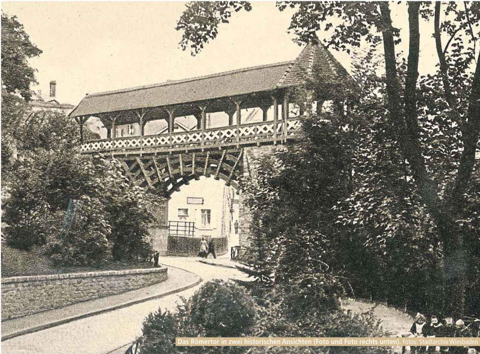
Das Römertor in zwei historischen Ansichten (Foto und Foto rechts unten).